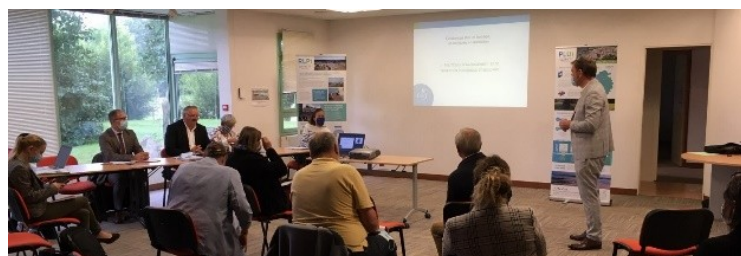
Rencontre communale PLUi – Gavray – 15 / 09 /2021

Vous souhaitez suivre le projet ? Rendez-vous sur le site internet www.coutancesmeretbocage.fr , rubrique « grand dossier urbanisme ». Pour recueillir les observations des habitants et professionnels, des registres de concertation sont disponibles dans les mairies, au siège et au service urbanisme de Coutances mer et bocage.