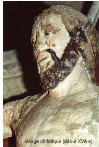
visage christique (début XV e s)

Le chœur présente tant à l'intérieur qu'à l'extérieur les caractéristiques d'un XV e siècle avancé. La piscine avec son arc en accolade, le mur absidal à pans coupés avec ses contreforts appliqués sur les angles, sont les signes des constructions de cette époque. A l'occasion des travaux