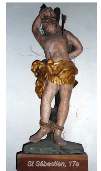
St Sébastien, 17 e